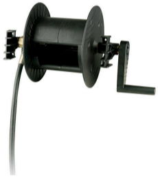
KIT RLW SENZA TUBO 40840