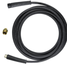
PROLUNGA TUBO ARMATO ALTA PRESSIONE (15 M) 40106