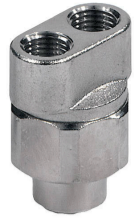
TESTINA DOPPIO UGELLO 3025