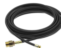
KIT PULIZIA TUBAZIONI (8 M) 1272520