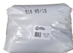
SABBIA CALIBRATA E FILTRATA (25 KG) 41770