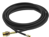
KIT PULIZIA TUBAZIONI (16 M) 1272530